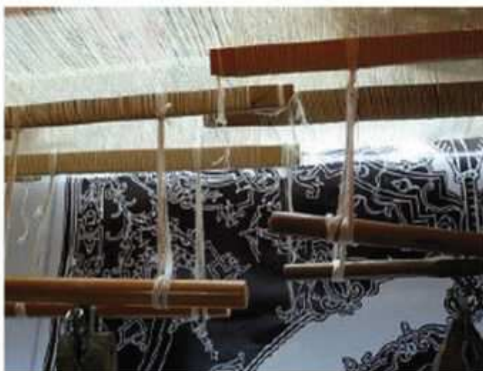
Carton pour le tissage de Peau de licorne, d'après Nicolas Buffe Copyright : Cité de la tapisserie

Le carton est placé sous la chaîne à laquelle il est fixé avec des épingles ou cousu. Il est déroulé au fur et à mesure de l'avancée du tissage sans être pris dans le rouleau. Le lissier suit le motif à réaliser en écartant les fils de chaîne pour voir, ou apercevoir, le modèle. Le tissage se fait généralement sur l'envers. Afin de vérifier le travail, il est contrôlé à l'aide d'un petit miroir glissé sous la chaîne. Il peut arriver que le carton soit inversé.