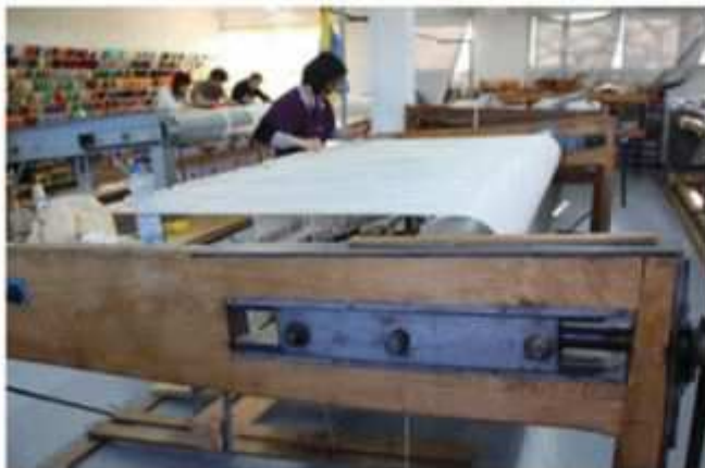
Le montage de la chaîne

Le montage de la chaîne se fait en deux nappes horizontales déterminées par fils pairs et impairs. Chaque fil, qui peut être simple, double, triple, etc., en fonction de l'effet souhaité, passe par une lisse : fils pairs par les lisses d'une même barre de lisse, fils impairs par les lisses d'une autre barre de lisse. Le montage de la chaîne assure aux tapisseries une stabilité de forme et une durabilité. Le tissage peut être réalisé en simple, double ou triple chaîne. La chaîne doit être égalisée.