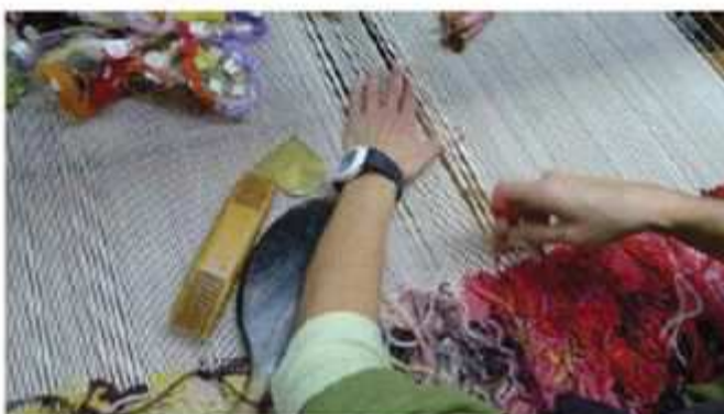
Détail d'un tissage en cours