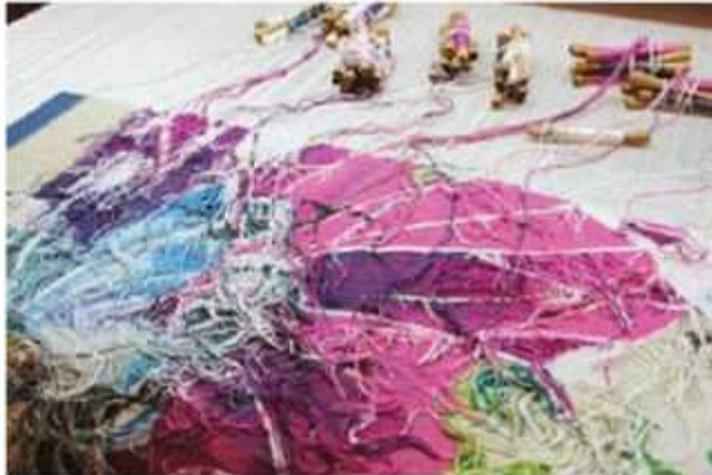
Tissage avec des flûtes

La tapisserie résulte de l'entrecroisement manuel de la chaîne et de la trame, partie visible de la tapisserie, dont les fils colorés enrobent la chaîne.