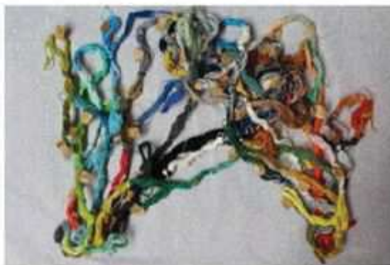
Chapelet de couleur ou nuancier

Ainsi les teintures ou à défaut, en fonction des stocks de matières des ateliers, les choix des fils de couleurs, sont réalisés « à la palette de l'artiste ». Il n'y a pas de restriction dans les couleurs car les lissiers ont besoin de s'adapter pour chaque tapisserie à réaliser. Cela suppose un fort lien avec le savoir-faire des teinturiers locaux dans le choix de la gamme de couleurs qui s'adapte à la tapisserie devant être tissée.