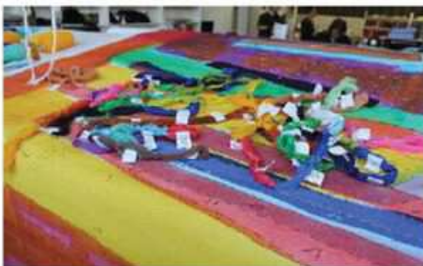
Détail d'un carton numéroté Copyright : Ateliers Pinton

La maquette n'est pas systématiquement conservée au sein des ateliers.