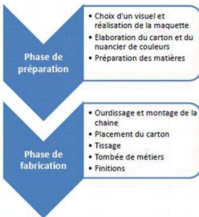
Schéma de fabrication d'une Tapisserie d'Aubusson

Ces finitions peuvent être réalisées en interne au sein d'un atelier ou externalisées sur l'aire géographique.