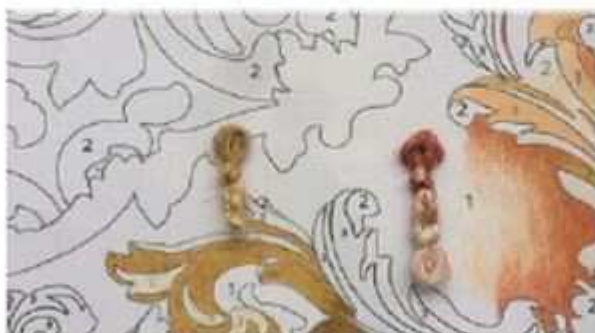
Détail d'un carton numéroté Copyright : Manufacture Robert Four