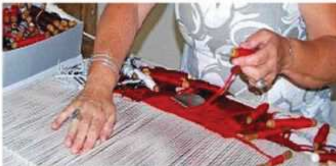
Détail d'un tissage en cours

Les passées de fils sont régulièrement tassées avec un doigt et/ou un grattoir, puis avec un peigne généralement en buis. Ces outils, le grattoir et le peigne, permettent d'obtenir un tissage particulièrement serré, conférant à la tapisserie achevée cette texture caractéristique de la tapisserie d'Aubusson.